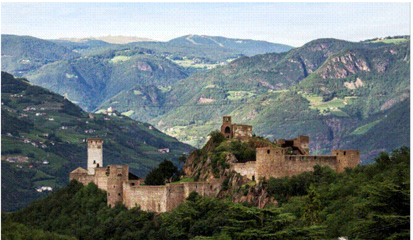
Sigmundskron