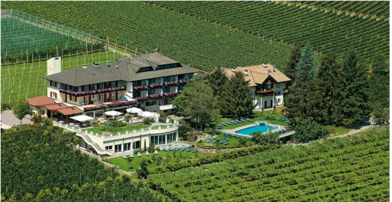
Unser Hotel - „ Wilma “ in Nals