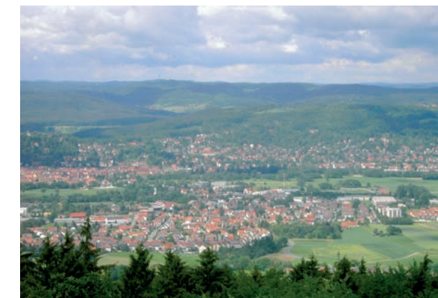
Blick vom Arzbergturm auf Hersbruck

Weitere Informationen unter: Tel. 09151 814384