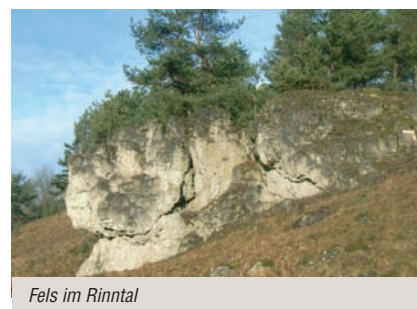
Fels im Rinntal

zugewonnen, der östliche Teil blieb bei Bayern. Erst nach dem Napoleon im Jahr 1806 Nürnberg dem bayerischen König zugesprochen hat, wurde der Ort wiedervereinigt.