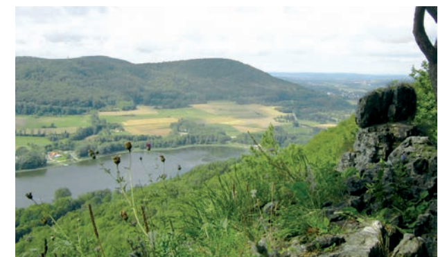
Blick von der Houbirg

Die verkehrspolitische sowie strategisch günstige Lage der Houbirg begünstigte wohl die ersten Ansiedlungen in der mittleren Bronzezeit (ca. 1600 v. Chr.).